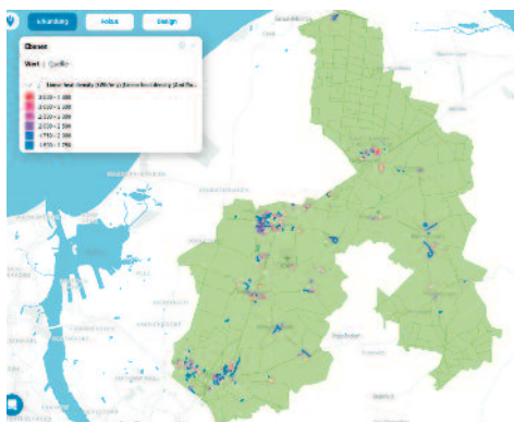
Amtsbereich mit Wärmelinien – je roter, desto höher ist der Wärmebedarf im Straßenabschnitt

gung – sowohl die zentrale über Wärmenetze als auch die private im eigenen Heizungskeller – auf erneuerbare Energie umgestellt werden. Der Wärmeplan zeigt z.B., wo sich im Amtsbereich geeignete Gebiete für die zentrale Wärmeversorgung befinden. Ob und wann diese Planung umgesetzt wird und Fernwärme genutzt werden muss, bleibt aber weiterhin offen. Die einzelne Gemeinde entscheidet nach Abschluss der Wärmeplanung, wie es weitergeht, z.B. mit weiterführenden Machbarkeitsstudien, Fachplanung, Satzungen usw.. Auf der Informationsveranstaltung werden die wichtigsten Ergebnisse der Bestands- und Potenzialanalyse, die untersuchten Fokusgebiete und die Karte mit den Eignungsgebieten für die zentrale und dezentrale Wärmeversorgung vorgestellt. Sie erhalten zudem die Möglichkeit, Verständnisfragen zu stellen, damit Unklarheiten vor Ort geklärt werden können.