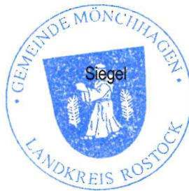
Karl-Friedrich Peters Bürgermeister

Soweit beim Erlass dieser Satzung gegen Verfahrens- und Formfehler verstoßen wurde, können diese nach § 5 Abs. 5 der Kommunalverfassung des Landes Mecklenburg-Vorpommern in der gültigen Fassung, nur innerhalb eines Jahres gelten gemacht werden. Diese Einschränkung gilt nicht für die Verletzung von Anzeige-, Genehmigungs- und Bekanntmachungsvorschriften.